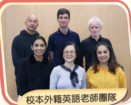
校本外籍英語老師團隊

本校早於2000年已參加當時教統局的「小學英語發展NET Scheme計劃」，引入以英語為母語的老師，強化學校的英語課程及教學，可見我們一直重視學生的英語學習效能。